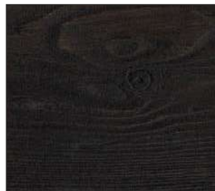
24 Wenge kongo