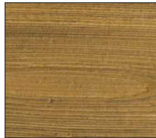
07 Dąb węgierski