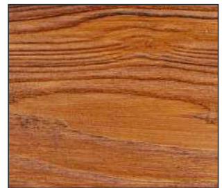
25 Dąb złoty