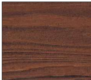
15 Dzika wiśnia