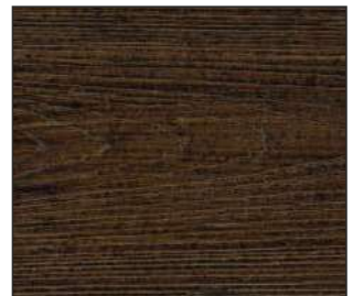
17 Orzech porto