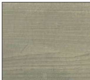
19 Oliwka bielona