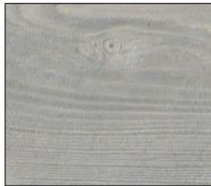
03 Jesion bielony