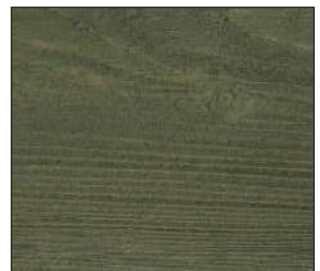
21 Hiszpańska oliwka