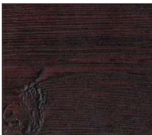
18 Ciemny machoń