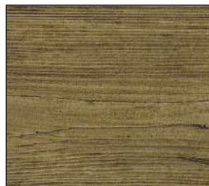
20 Sosnowa kora