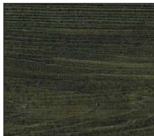
23 czarna olcha