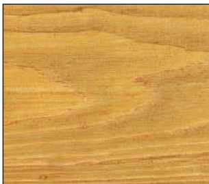
13 Sosna górską