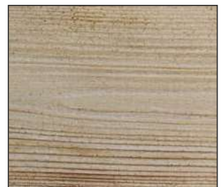
30 Sosna skandynawska