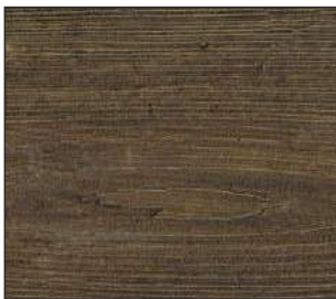
22 Drzewo bete