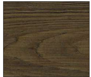
12 Śliwa łącka