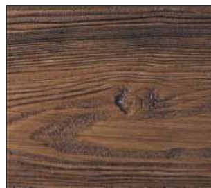
29 Ciemny orzech