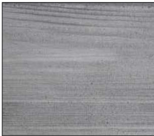
01 Klon srebrny